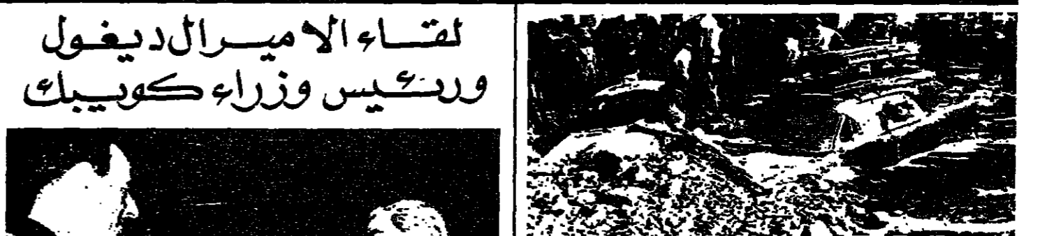
سيارات مسي اتينا مدرتها الفيضانات